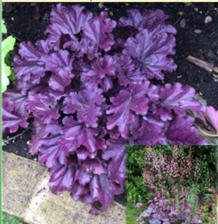
Гейхера 'Фростед Вайолет' ( Heuchera hybrida 'Frosted Violet')