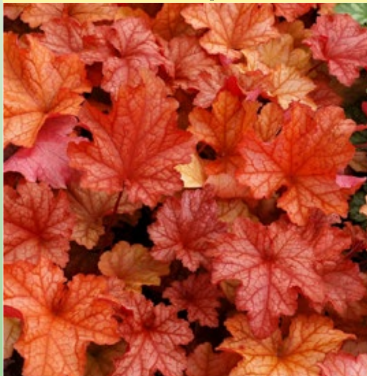
Гейхера Паприка ( Heuchera 'Paprika' )