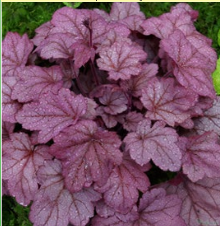
Гейхера 'Грейп Сода' ( Heuchera hybrida 'Grape Soda' )