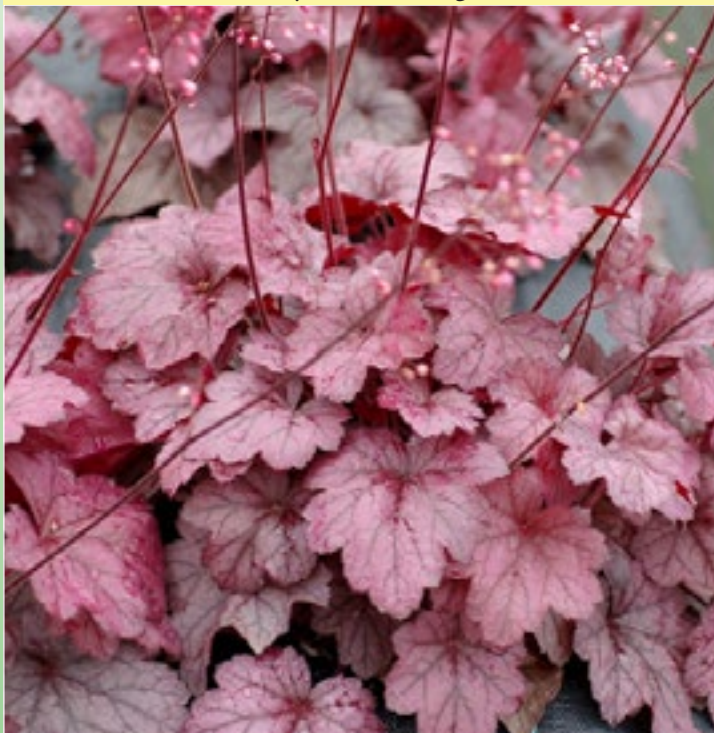
Гейхера 'Джорджия Плам' ( Heuchera hybrida 'Georgia Plum')