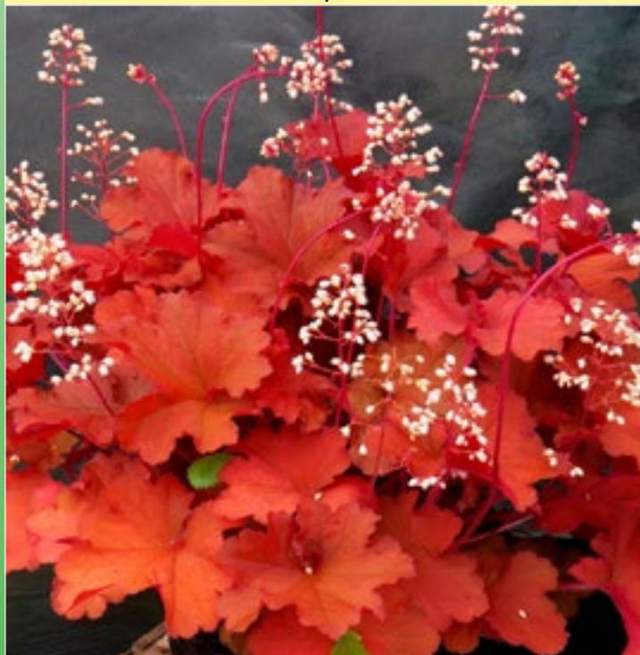
Гейхера Рио ( Heuchera hybrida 'Rio' )