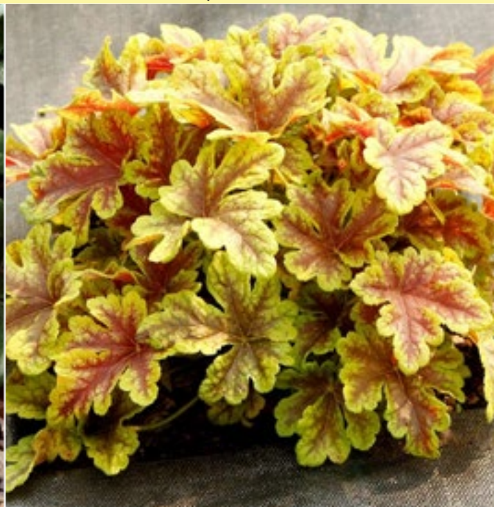
Гейхера 'Голден Зебра' ( Heuchera hybrida 'Golden Zebra' )