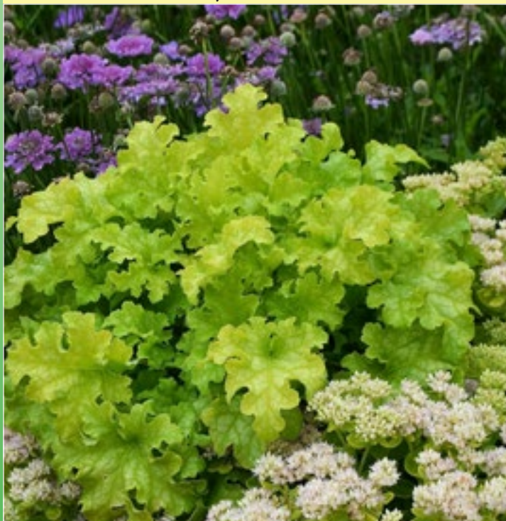
Гейхера 'Лайм Раффлс' ( Heuchera hybrida 'Lime ruffles' )