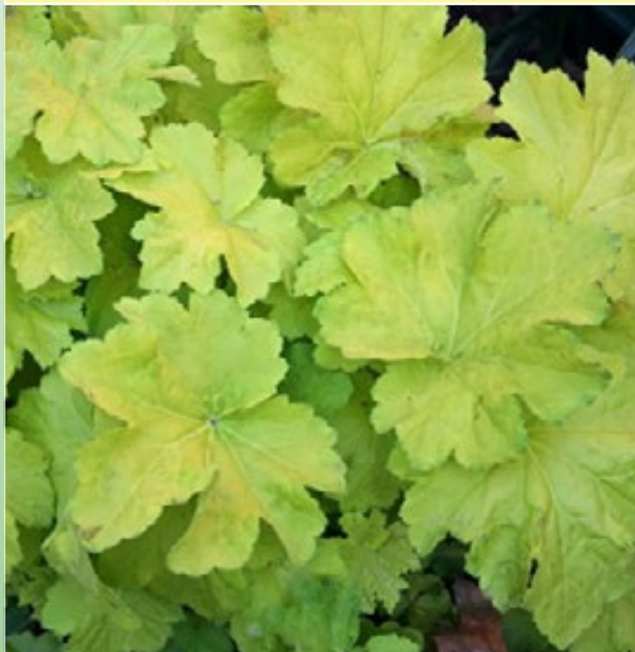
Гейхера 'Фисташ' ( Heuchera villosa 'Pistache')