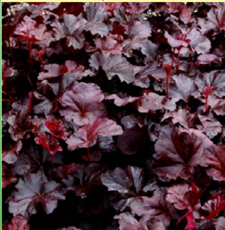
Гейхера 'Обсидиан' ( Heuchera hybrida 'Obsidian' )