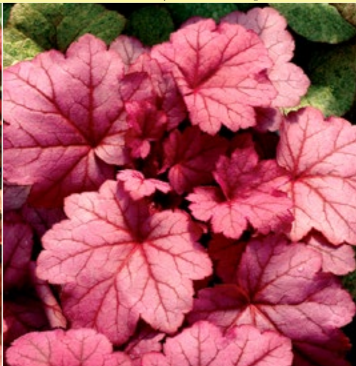
Гейхера 'Пенелопа' ( Heuchera hybrida 'Penelope' )