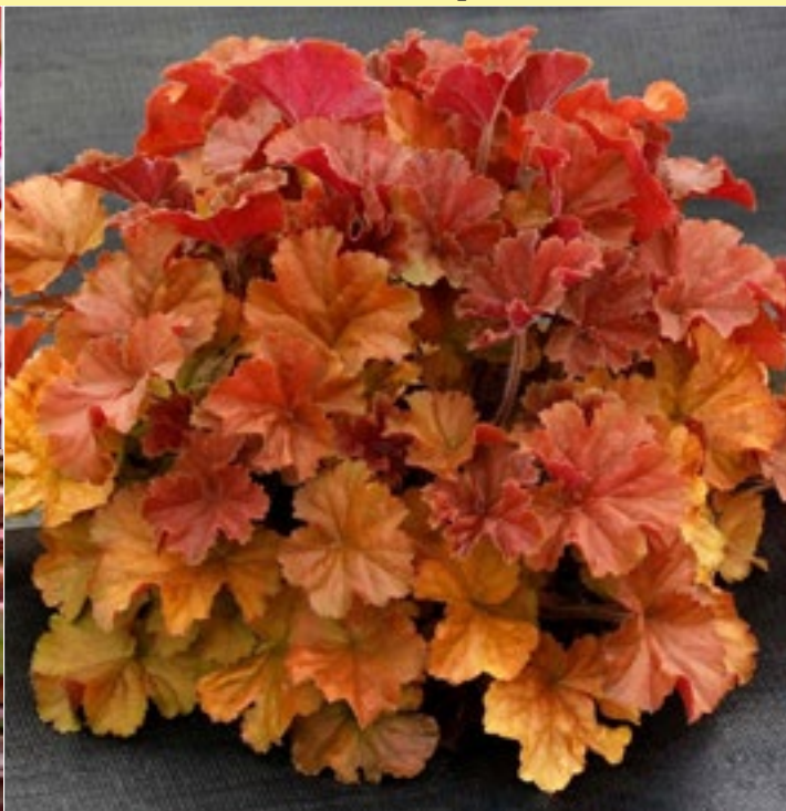
Гейхера 'Нортен Экспозюре Эмбер' ( Heuchera 'Northern Exposure Amber' )