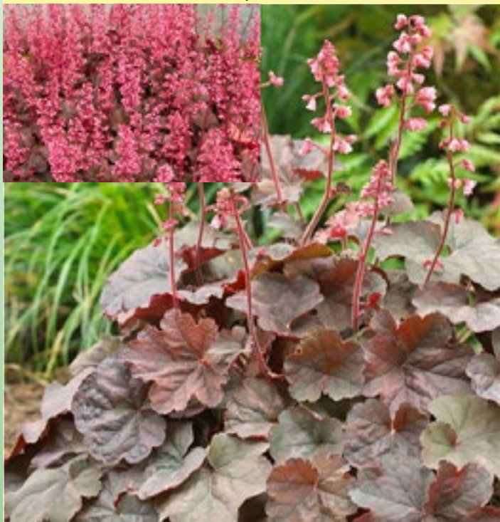
Гейхера 'Кассис' ( Heuchera hybrida 'Cassis' )