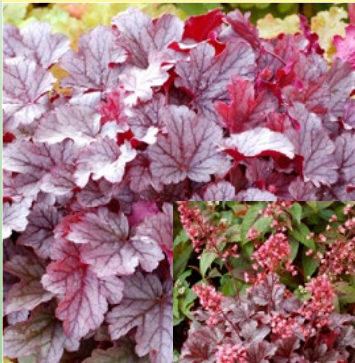
Гейхера 'Милан' ( Heuchera 'Milan' )