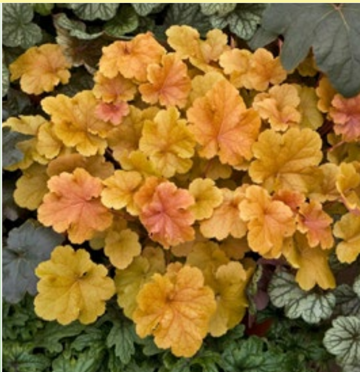
Гейхера 'Криста' ( Heuchera 'Christa' )