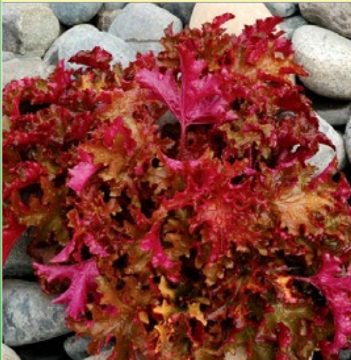
Гейхера 'Зиппер' ( Heuchera hybrida 'Zipper')