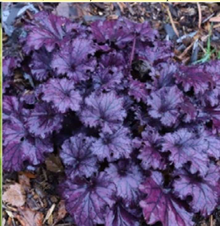
Гейхера 'Форева Пёпл' ( Heuchera hybrida 'Forever Purple')