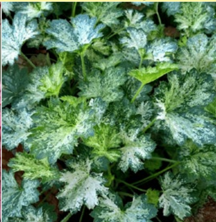
Гейхера 'Дью Дропс' ( Heuchera 'Dew Drops')