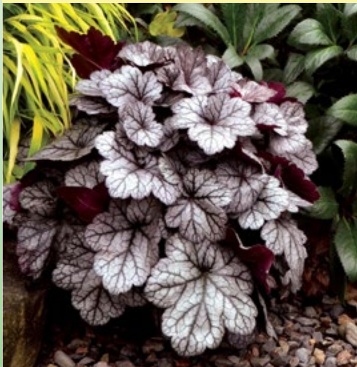
Гейхера 'Глиттер' ( Heuchera 'Glitter' )